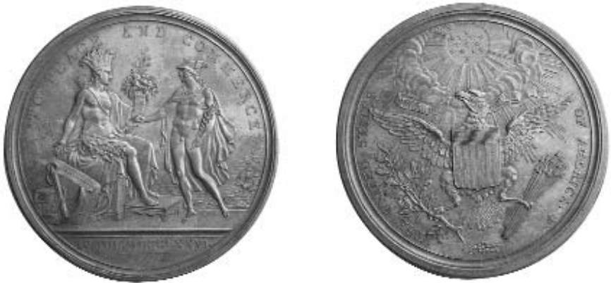
Augustin Dupré, Diplomatic Medal, c. 1792, bronze striking from original dies, gift of Cornelius C. Vermeule III, 2003. [actual diameter 68 mm]