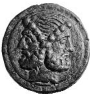
Asse librale della zecca di Roma (fine IV - primo quarto del III secolo a.C.) (Medagliere del Museo Nazionale Romano - Collezione Kircheriano)