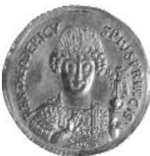
Medaglione aureo di Teodorico rinvenuto in una tomba in Senigallia (Ancona) (Medagliere del Museo Nazionale Romano - Collezione Gnecci)