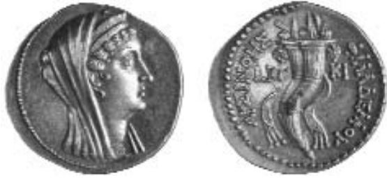
Ptolemaic Egypt, Ptolemy VI, 163-145 BCE, gold octadrachm of Arsinoe, Kition (Cyprus) mint, acquired with funds from the Townsend-Vermeule Fund, 2002.