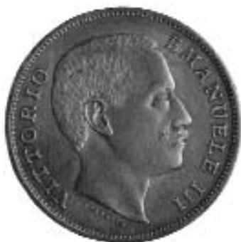
L. 2 in argento di Vittorio Emanuele III- zecca di Roma (Medagliere del Museo Nazionale Romano - Collezione Reale)