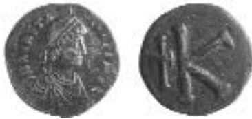
Byzantium, Anastasius, pre-reform, 498-507, bronze 20 nummi, Constantinople, Antioch excavations, 1939.